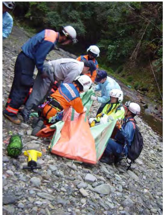
救助現場(事故現場)に医師が降下して治療を開始する連携も実施しています。