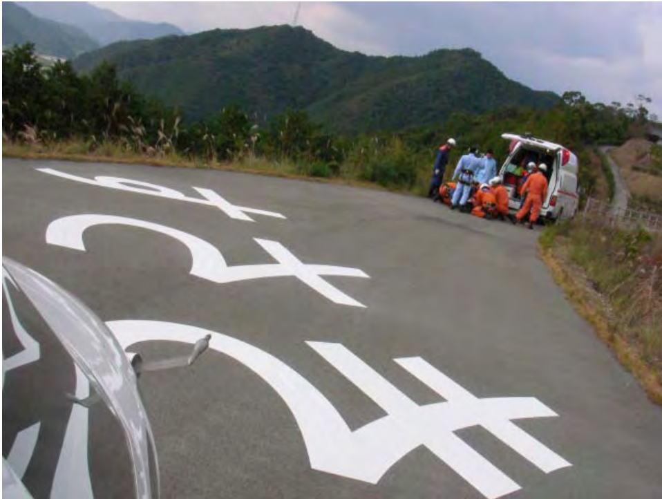
空き地を利用した簡易舗装の離着陸場が消防機関との連携の鍵になっています。